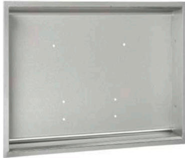
KT0016HCS Acabado escovado