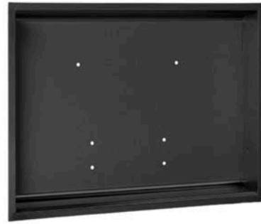
KT0016HCSB Acabado preto mate